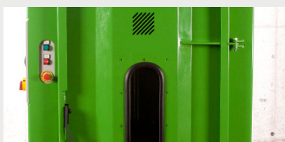
Bloqueo de la puerta para mayor seguridad