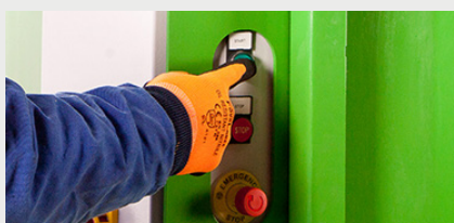
Panel de control IP54 para facilitar el manejo