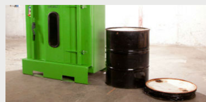
Bidones prensados hasta una fracción de su tamaño