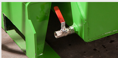
Tanque de retención de hasta 40 litros de líquido con grifo de salida